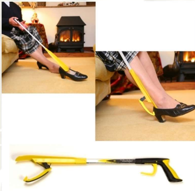
Calçador i descalçador de sabates