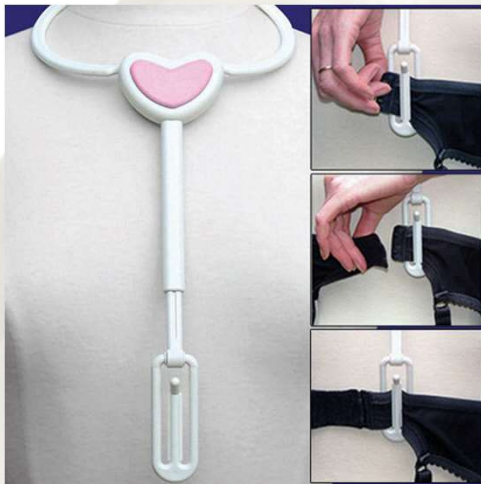
Bra angel / corda sostenidors